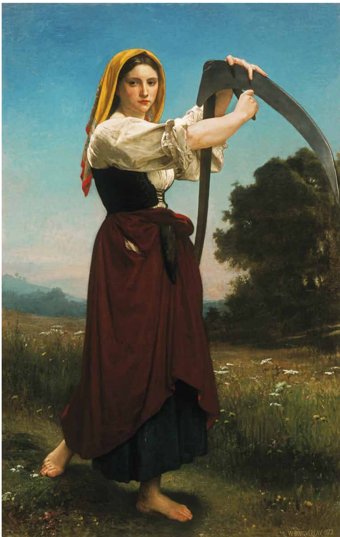
William-Adolphe Bouguereau, La segadora , 1872. Óleo sobre lienzo 179,1 x 115,9 cm. Colección Pérez Simón, México