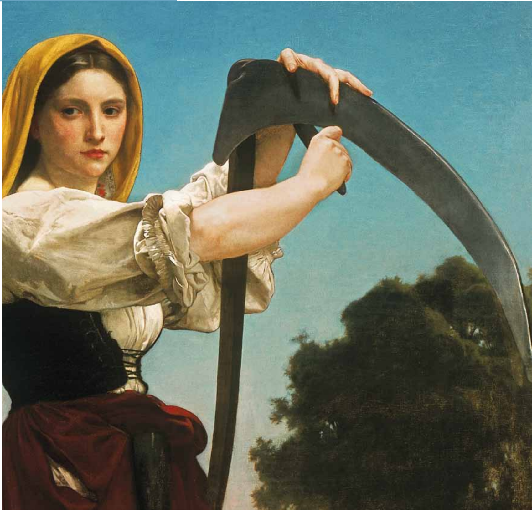
William-Adolphe Bouguereau, La segadora (detalle), 1872. Óleo sobre lienzo 179,1 x 115,9 cm. Colección Pérez Simón, México.